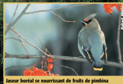
Jaseur boréal se nourrissant de fruits de pimble

Vous pouvez aussi nourrir les oiseaux, mais n'oubliez pas l'eau.