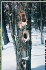
Chicot utilisé par les pics

Pour favoriser l'accroissement du nombre d'oiseaux indigènes, il faut faciliter les déplacements d'un site à l'autre en créant des corridors de verdure. En reliant entre eux les grands parcs boisés, les petits parcs, les friches et les arrière-cours, nous permettons aux oiseaux de bénéficier d'un véritable réseau d'habitats.