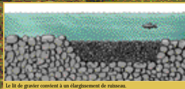
Le lit de gravier convient à un élargissement de ruisseau.

L'aménagement ou la restauration d'une frayère vise l'amélioration des conditions de reproduction. Le cours d'eau doit être nettoyé et exempt de débris. Il faut ensuite choisir l'emplacement qui réunit le plus de conditions de succès et vérifier si d'autres aménagements (seuils, fosses, abris, etc.) sont nécessaires à proximité. Le choix de la technique appropriée se fait ensuite en fonction des caractéristiques du cours d'eau.