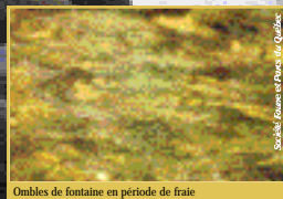
Ombles de fontaine en période de fraye

L'omble de fontaine, qui fraye à faible profondeur, a besoin d'eau fraîche en toutes saisons, d'un courant vif et d'un lit de gravier propre afin que les œufs soient bien oxygénés. Une bonne frayère se situe aussi à proximité de sources de nourriture, d'abris et de fosses.