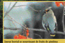
Jaspe boréal se nourrissant de fruits de pinbina

Vous pouvez aussi nourrir les oiseaux, mais n'oubliez pas l'eau.