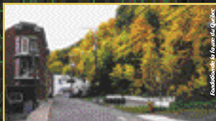
Coteau Sainte-Geneviève, une bande de verdure entre la haute et la basse ville de Québec où nichent 26 espèces d'oiseaux.

En ville, les espaces verts améliorent notre qualité de vie. Ils nous procurent de précieux moments de détente et embellissent le paysage urbain. Cependant, ces parcs, ces bandes riveraines, ces boisés ou ces terrains vagues ont un potentiel inexploité. Nous pouvons les transformer en véritables habitats fauniques prêts à accueillir nos oiseaux indigènes.